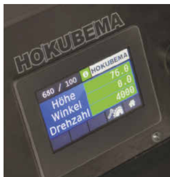
/ Gut lesbar: das Touch-Display mit hoher Helligkeit und großem Kontrast.

unter anderem ein durchdachter Parallelanschlag sowie ein elektrisch angetriebenem Breitenanschlag mit Kugelrollspindel. (lp)