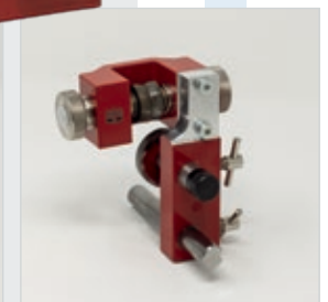
Untere Bandsägeblattführung APA 2