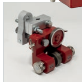
Obere Bandsägeblattführung APA 2